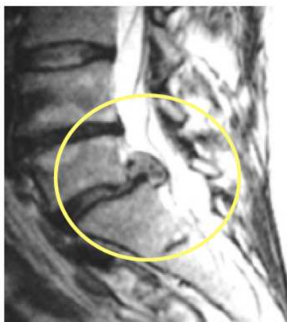
Resonancia Magnética antes