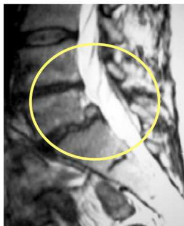
Resonancia Magnética 6 meses después

Estudios realizados por especialistas de alto prestigio avalan la eficacia de DiscoGel® en el tratamiento de hernias discales